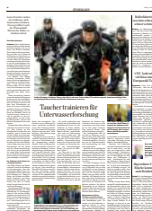
Hamburger Abendblatt 04/24: shorturl.at/47rlb

Für die praktischen Übungen geht es zu den echten Fundstellen im Grobensee. An drei Beifundwracks lernst du Methoden der Wracksuche, Positionsbestimmung und das Anfertigen einer Befundaufnahme. Eine amtliche Fundmeldung rundet deinen ersten unterwasserarchäologischen Einsatz ab. Als Bonus führt dich ein Tauchgang zu den zwei untersuchten, über 100 Jahre alten Fischerkähnen. Normalerweise ist der Grobensee für Taucher gesperrt. Eine Sondergenehmigung erlaubt uns diesen exklusiven Einstieg. Für manchen sicher ein besonderer Eintrag im Logbuch.