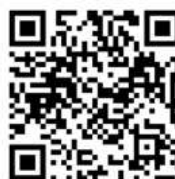
Impressionen vom Denkmalkurs 2024